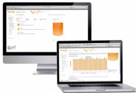
Hier haben Sie Ihren Verbrauch auf dem Schirm: die Smart Meter Online-Auswertung.

Auch Cleverness ist Typfrage. Deshalb erhalten Sie die Smart Meter-Tarife sowohl für KlimaFair Strom als auch für Top Strom. So können Sie weiterhin, wie gewohnt, den Strom Ihrer Wahl nutzen und gleichzeitig von den Vorteilen des Smart Meterings profitieren.